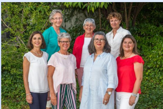
Herzlichst, Leitteam der NHA

Das Leitteam wünscht euch frohe Festtage sowie ein gutes, gesundes und glückliches Neues Jahr. Möge es viel Freude bringen.